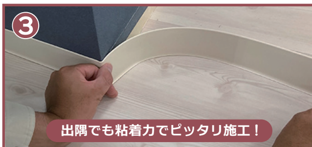
出隅でも粘着力でピッタリ施工！