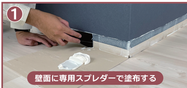
壁面に専用スプレダーで塗布する