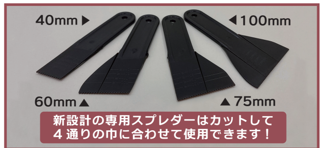
新設計の専用スプレダーはカットして 4通りの巾に合わせて使用できます！