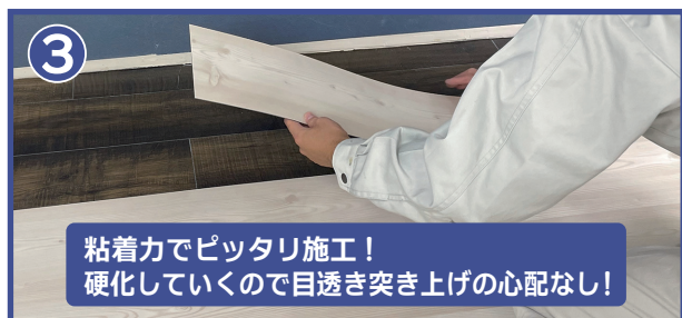
③ 粘着力でピッタリ施工！ 硬化していくので目透き突き上げの心配なし！